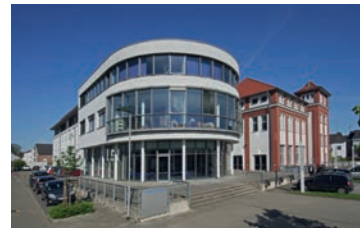
Ihr „Haus der Weiterbildung“, das Weiterbildungskolleg der StädteRegion Aachen, Standort Würselen

Bewerbungsunterlagen sind erhältlich in den Sekretariaten oder auf der Homepage unter www.wbk-ac.de