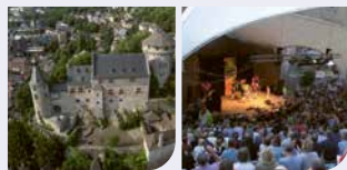
Stadt Stolberg 57.608 Stadt Würselen 40.202

Einwohnerzahlen: Quelle: IT.NRW - Stand 30.06.2025