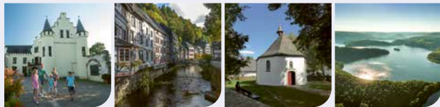
Stadt Herzogenrath 48.705 Stadt Monschau 12.383 Gemeinde Roetgen 8.763 Gemeinde Simmerath 16.552