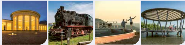
Stadt Aachen 262.211 Stadt Alsdorf 48.668 Stadt Baesweiler 29.076 Stadt Eschweiler 57.500

Die StädteRegion Aachen ist ein Gemeindeverband. Sie übernimmt Aufgaben für diese zehn Städte und Gemeinden: