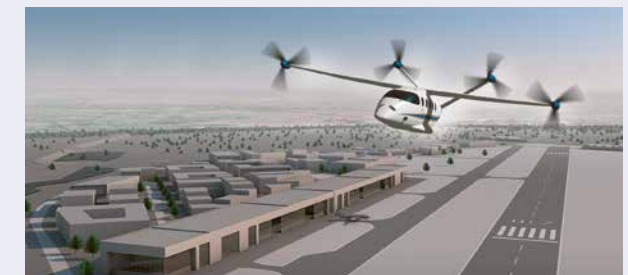
Von der Vision zur Realität: Auf dem Forschungsflugplatz Würselen Aachen werden Weichen für den Flugverkehr der Zukunft gestellt - mit zahlreichen Arbeitsplätzen.