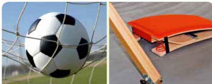
Helmut Etschenberg Städteregionsrat der StädteRegion Aachen

Der RSB übernimmt ab dem 01.01.2017 die Antragsbearbeitung und Auszahlung der Sportfördermittel der StädteRegion. Deshalb sind die Anträge ab diesem Zeitpunkt direkt dort zu stellen. Die Anträge zur Beschaffung von Sportgeräten/Geräten für die Vereinsarbeit sind wie bisher über die jeweilige Kommune einzureichen. Die neuen Antragsvordrucke finden Sie auf der homepage des RSB unter www.regio-sportbund-aachen.de .